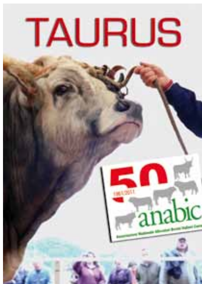
Toro di razza Romagnola

Periodico dell'Associazione Nazionale Allevatori Bovini Italiani da Carne