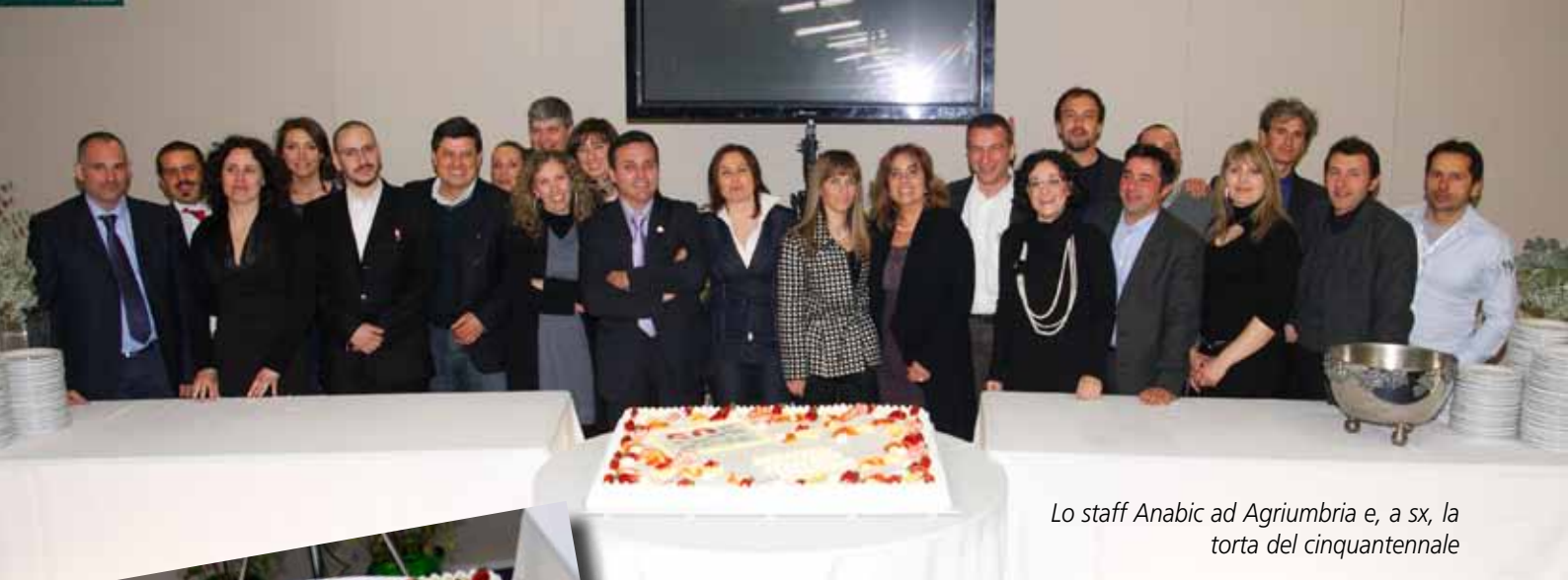
Lo staff Anabic ad Agriumbria e, a sx, la torta del cinquantennale