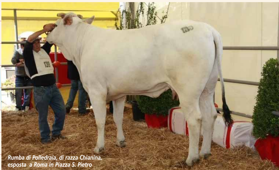
Rumba di Polledraia, di razza Chianina, esposta a Roma in Piazza S. Pietro

La festa di Sant'Antonio si è conclusa domenica mattina con l'Angelus del Papa, che ha salutato con parole affettuose gli allevatori presenti con l'Associazione Italiana Allevatori in piazza San Pietro per onorare il loro patrono.