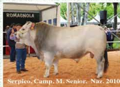
Serpico, Camp. M. Senior. Naz. 2010