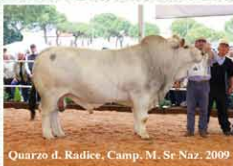
Quarzo d. Radice, Camp. M. Sr Naz. 2009