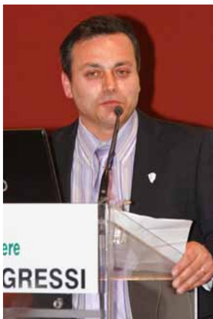
Il Presidente Anabic Fausto Luchetti

sul maxischermo che troneggiava sopra al palco, mentre l'ambiente era allestito con pannelli recanti belle immagini delle cinque razze bovine italiane da carne che offrivano uno splendido colpo d'occhio. Il convegno è stato preceduto da un breve spot di apertura che, a partire dal logo del 50° Anabic, oggetto delle celebrazioni che hanno avuto corso in questa edizione di Agriumbria, proponeva vecchie immagini delle razze, a simboleggiare il loro passato, seguite poi da splendide immagini delle razze stesse ai giorni nostri, che andavano in dissolvenza sulle riprese aeree del rinnovato Centro Genetico "Lucio Migni", ovvero il futuro per l'attività dell'Associazione. Non è mancato infine un riferimento al 150° anniversario dell'Unità d'Italia, sintetizzato nella frase: