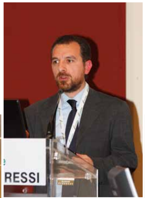
La sala di Agriumbria durante il convegno

ha poi affrontato il tema del mancato finanziamento pubblico alle APA, sottolineando come la mancanza di adeguate risorse a disposizione del sistema selettivo, si ripercuoterebbe negativamente soprattutto su quelle piccole e medie aziende di collina e di montagna che rappresentano la principale risorsa per le 5 razze tutelate da Anabic.