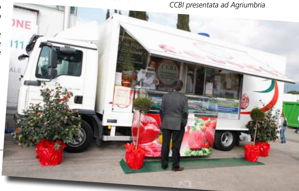
La Macelleria Mobile del Consorzio CCBI presentata ad Agriumbria

A conclusione di queste note deve essere sottolineato come Agriumbria abbia offerto ancora una volta grande visibilità alla Chianina, indiscussa regina dell'evento, e a tutta la sua filiera. In fiera, accanto al ristorante Oro Bianco, che ha avviato durante l'evento numerose iniziative per la valorizzazione della carne Chianina IGP, è stato presente anche il Consorzio CCBI con la propria macelleria mobile, che rappresenta un'opportunità per la valorizzazione della carne anche per aziende di piccole e medie dimensioni che non essendo attrezzate per il sezionamento della carne non dispongono di altri strumenti per valorizzazione e la vendita della carne prodotta in azienda. Anche lo stand AIA per la valorizzazione dei prodotti tutelati dal marchio ITALIALLEVA era incastonato tra le pensiline del bestiame delle diverse razze, a testimoniare la vicinanza del prodotto finito alle sue radici più autentiche, che sono le sole in grado di dare un valore aggiunto al territorio, come è stato ribadito più volte anche nel corso del convegno.